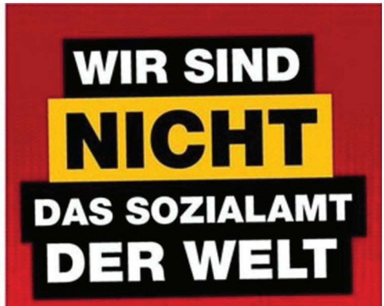
Wahlplakate Bundestagswahl 2013 / links AfD, rechts NPD